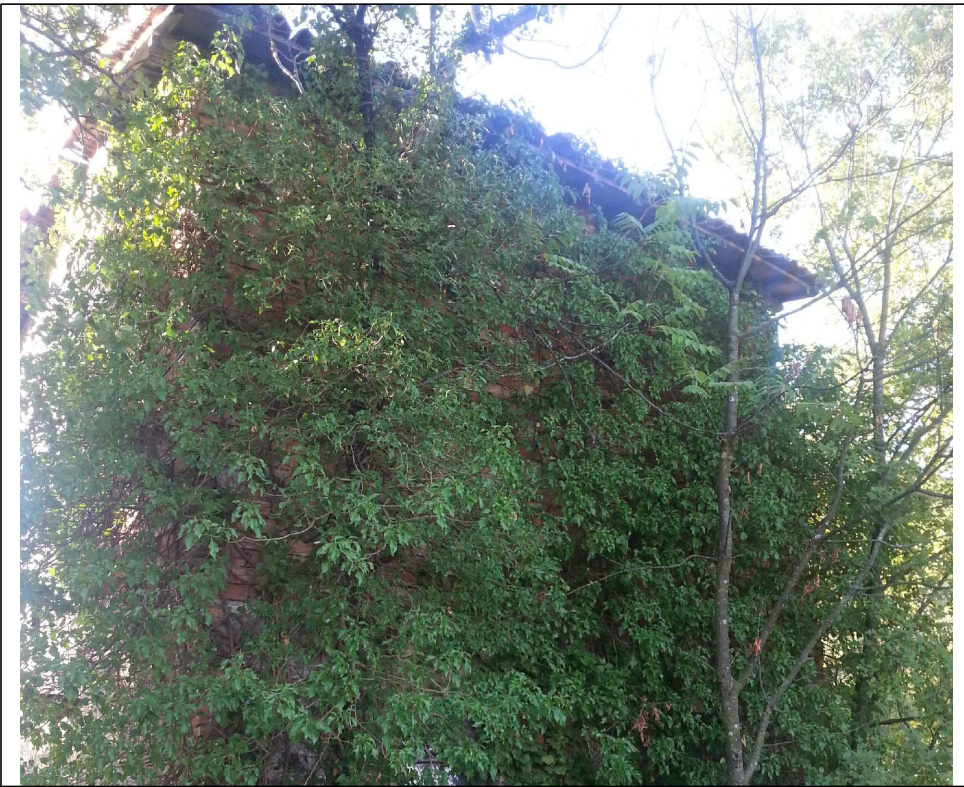
VISTA (5) DEL FRONTE NORD-EST

luogo: località Rossena, Canossa, Reggio Emilia