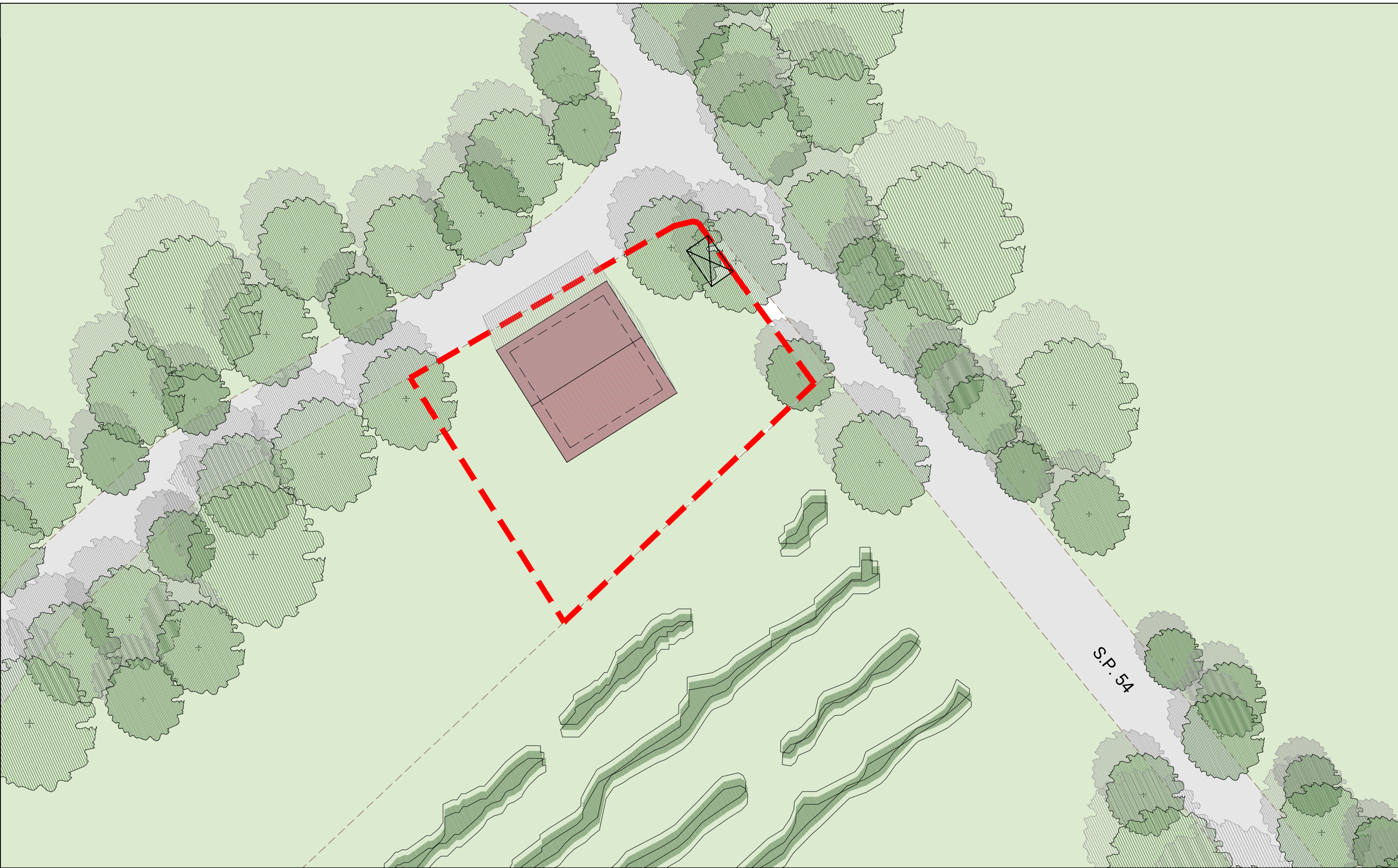
PLANIMETRIA DI INQUADRAMENTO scala 1:200

0\11 Arteas Progetti\2019\14_19 Planivolumetrici Canossa\Progettazione\4 Disegni\5 Edificio Rossena\Edificio Rossena.dwg 10.2019