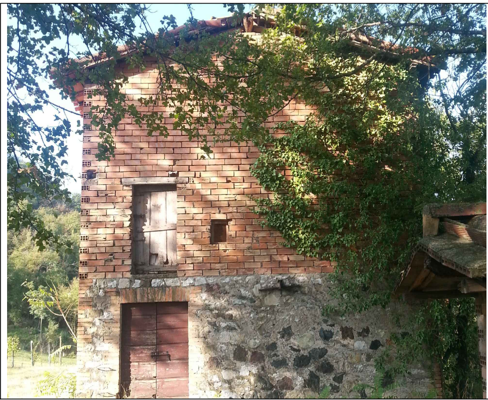
VISTA (2) DEL FRONTE NORD-EST