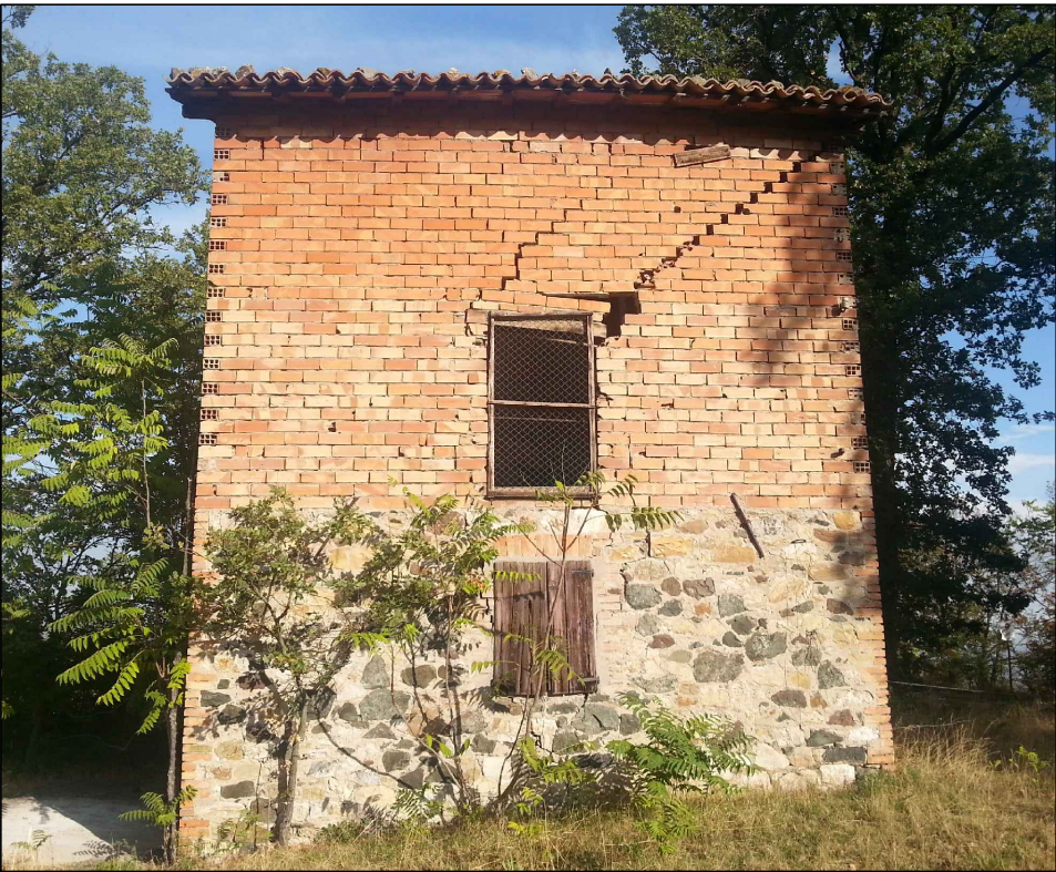
VISTA (3) DEL FRONTE SUD-EST