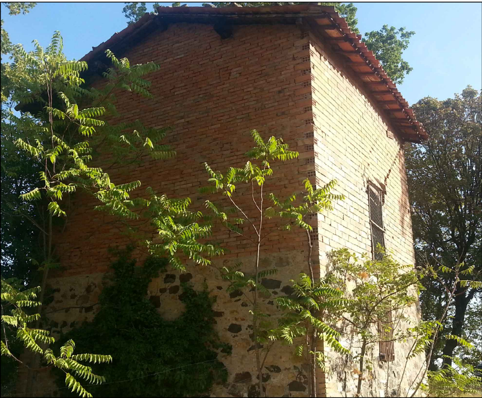
VISTA (4) DEL FRONTE SUD-OVEST