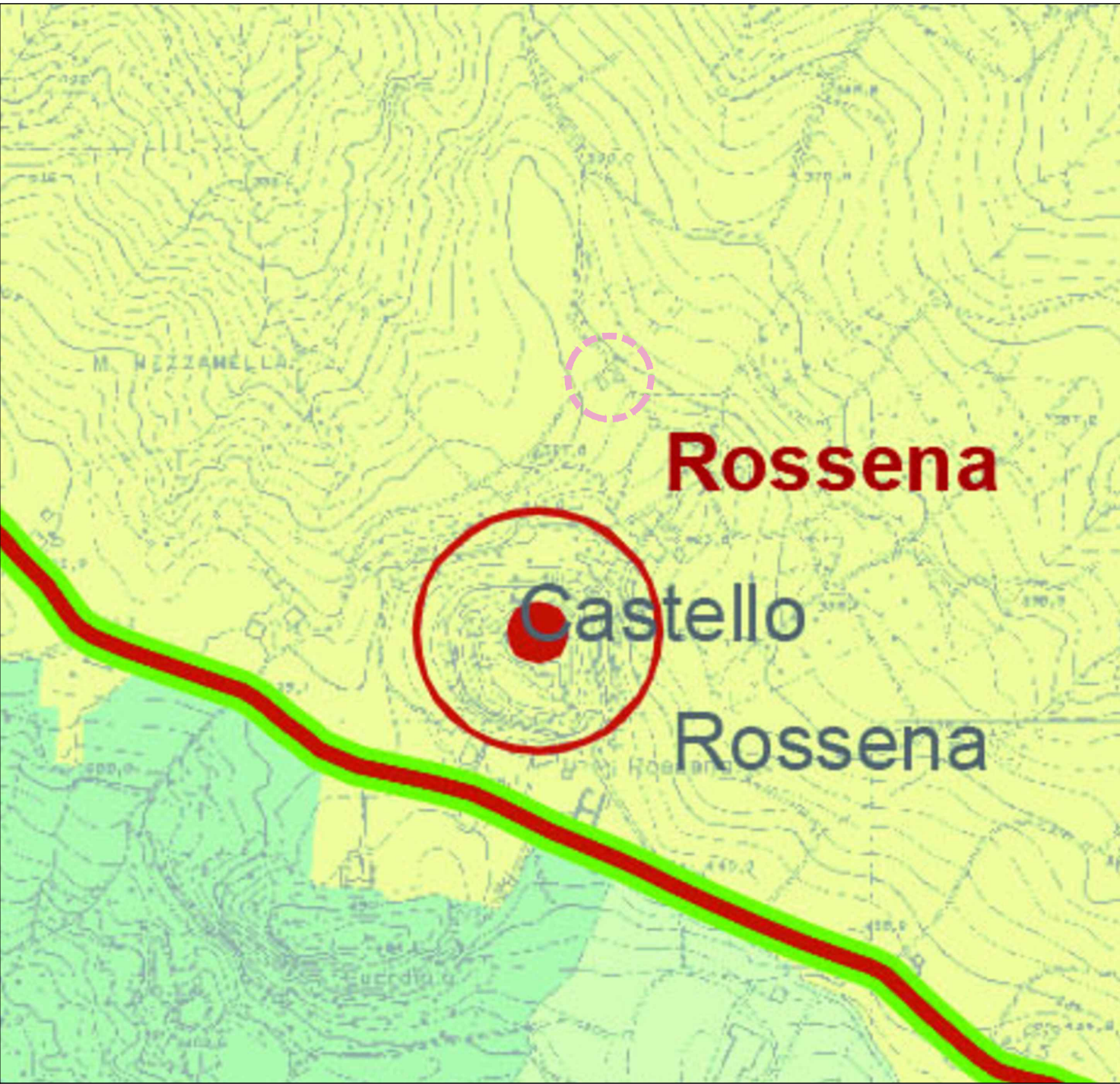
P.T.C.P. tutele e vincoli di natura paesaggistica ed antropica