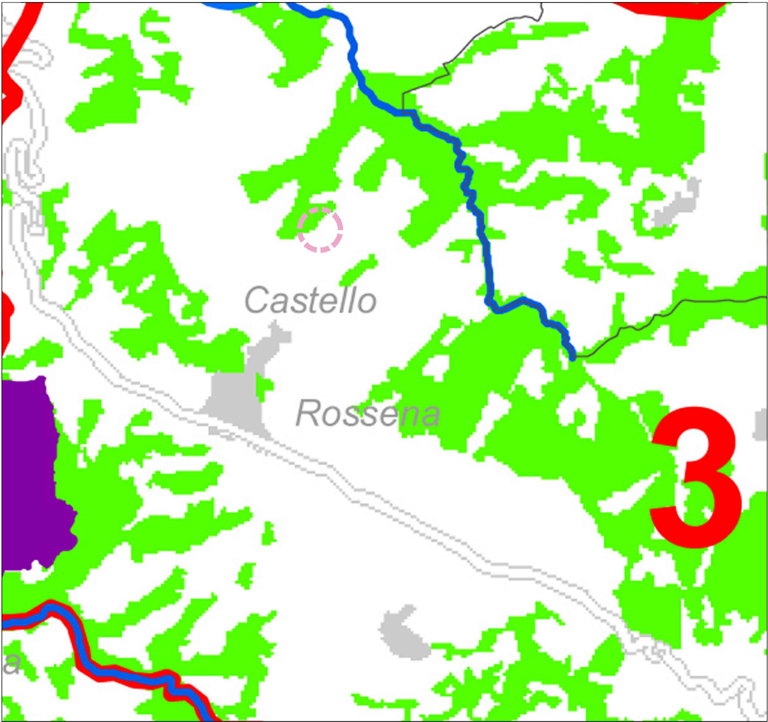
P.T.C.P. beni paesaggistici (D. lgs 42/2004)