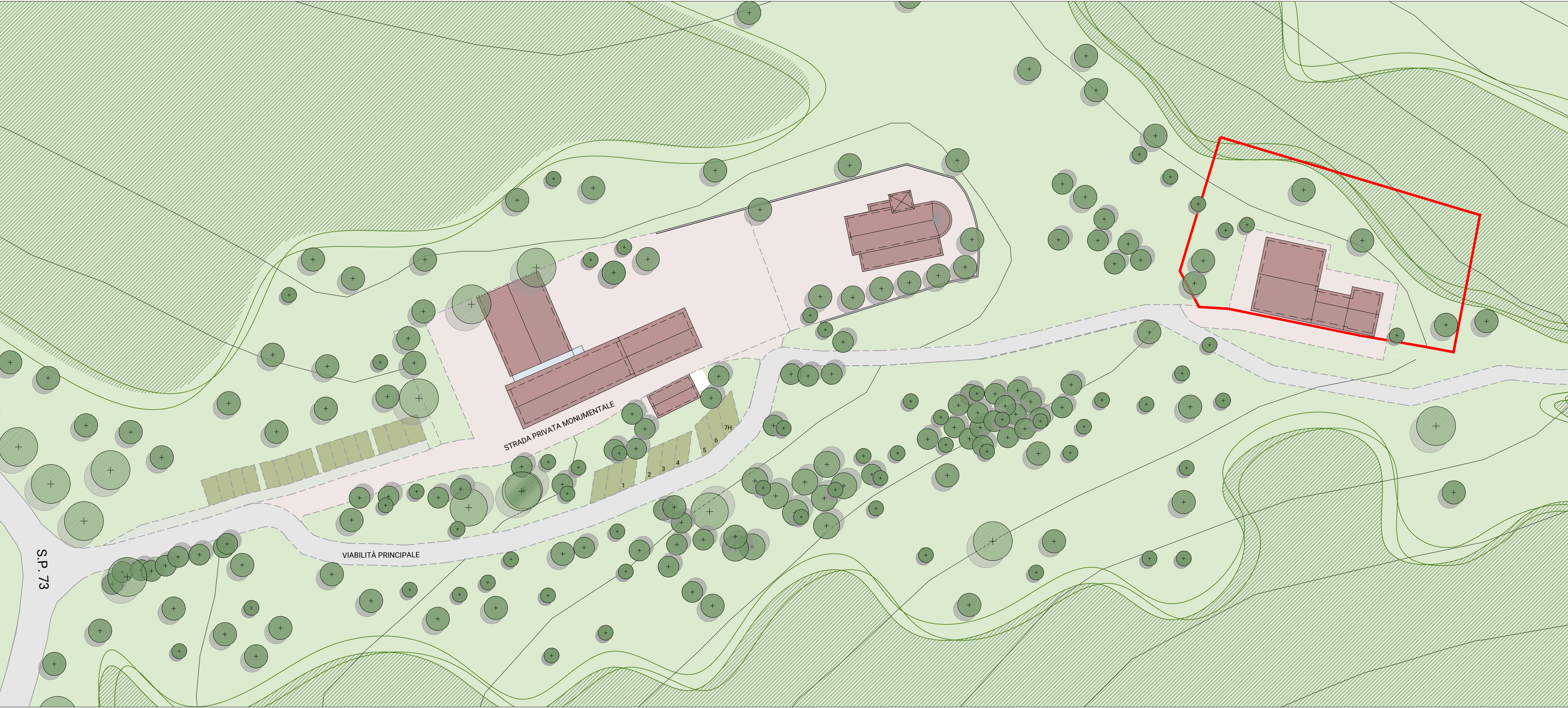
PLANIMETRIA DI INQUADRAMENTO scala 1:500

O:\1 Artesas Progetti\2019\14_19 Planivolumetrici Canossa\Progettazione\4 Disegni\4-Casino\VarUrb_Casino AGGIORNAMENTO.dwg 11.2019