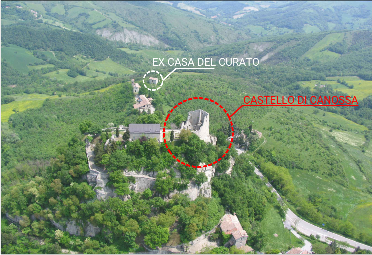
1. VISTA AEREA