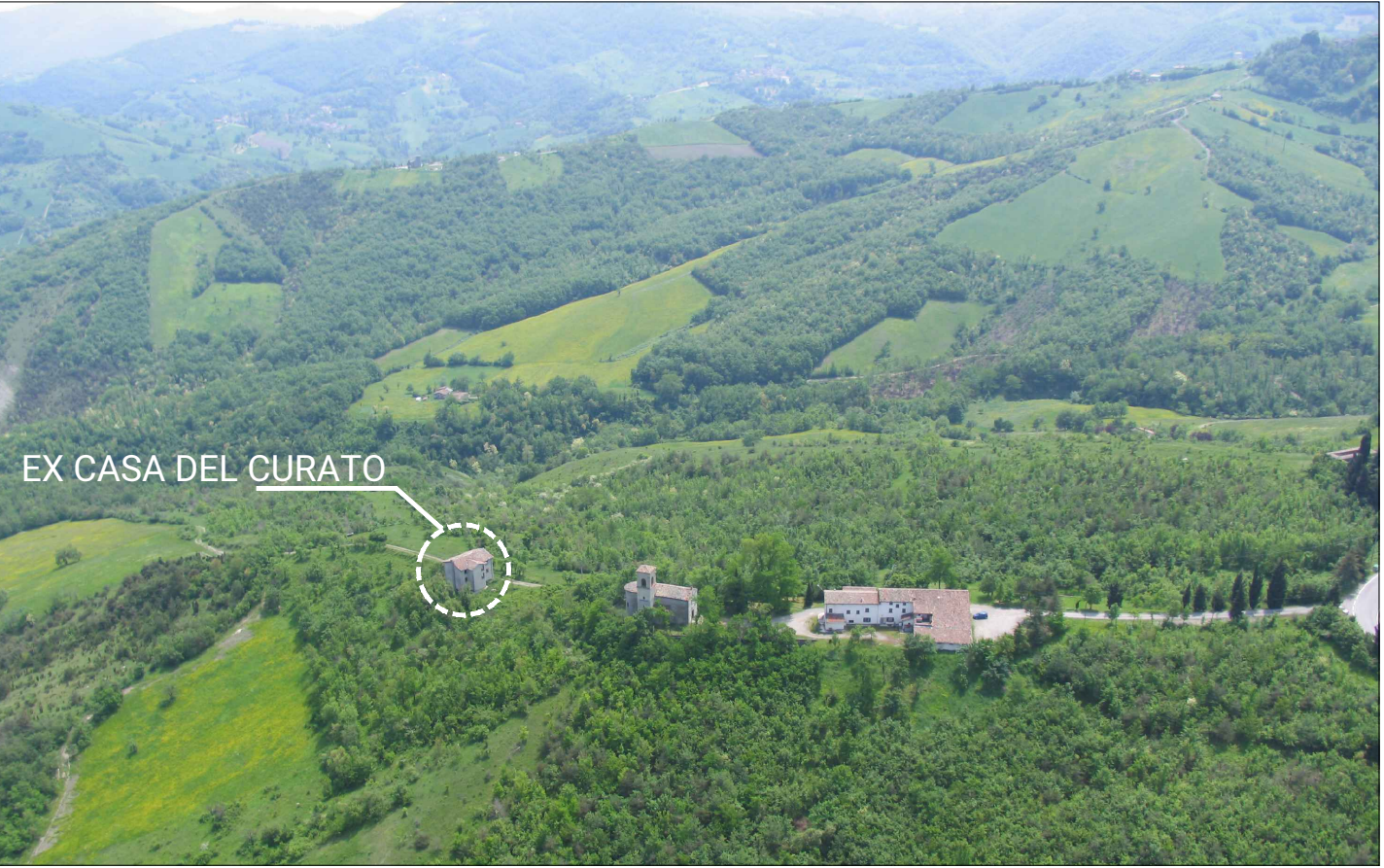
2. VISTA AEREA A NORD-OVEST DELLA EX CASA DEL CURATO, DELLA CHIESA DI SAN BIAGIO E DELLA EX CASA DEL CLERO