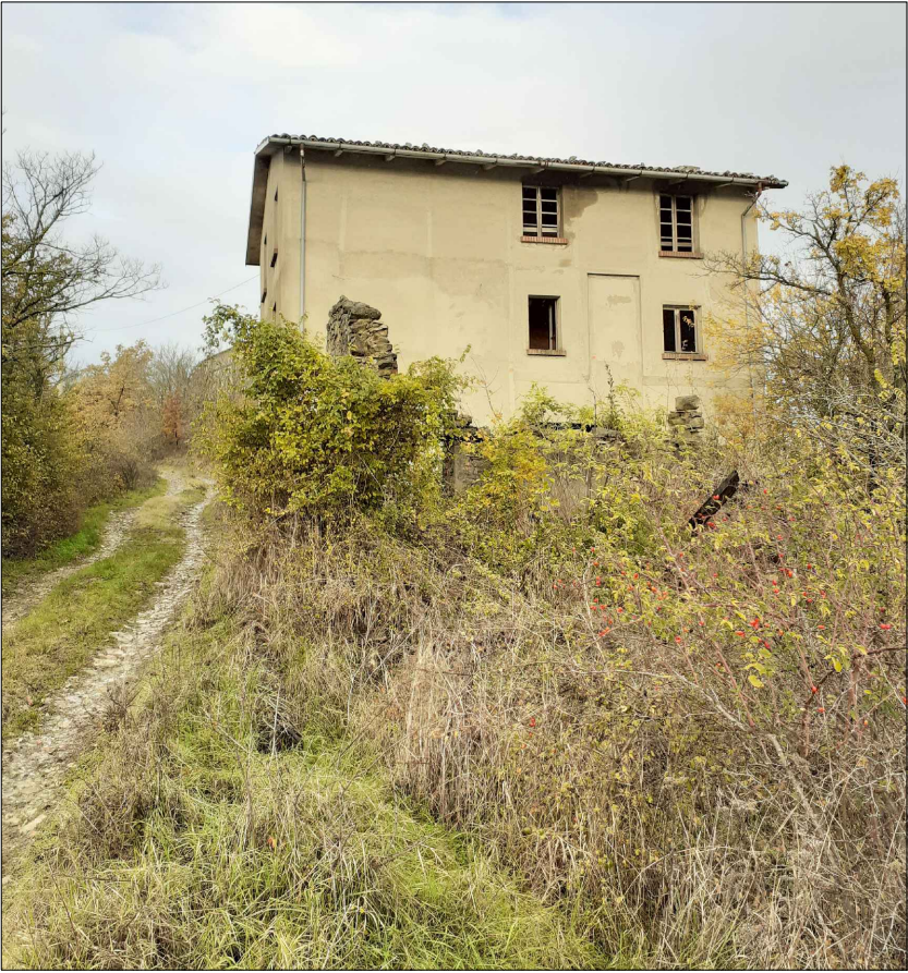
4. PROSPETTO EST

luogo: località Castello di Canossa, Canossa, Reggio Emilia committente: Canossa San Biagio s.r.l.