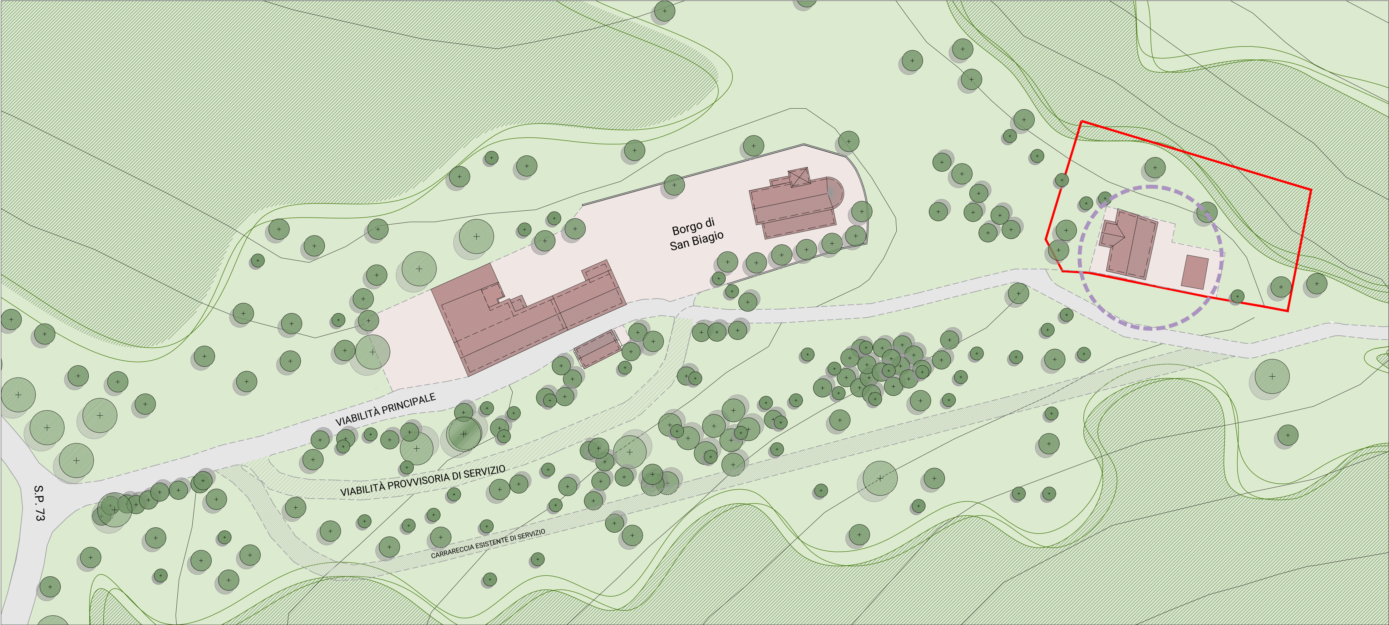
PLANIMETRIA DI INQUADRAMENTO scala 1:500

O:\1 Arteas Progetti\2019\14_19 Planivolumetrici Canossa\Progettazione\4 Disegni\4-Casino\VarUrb_Casino AGGIORNAMENTO.dwg 11.2019