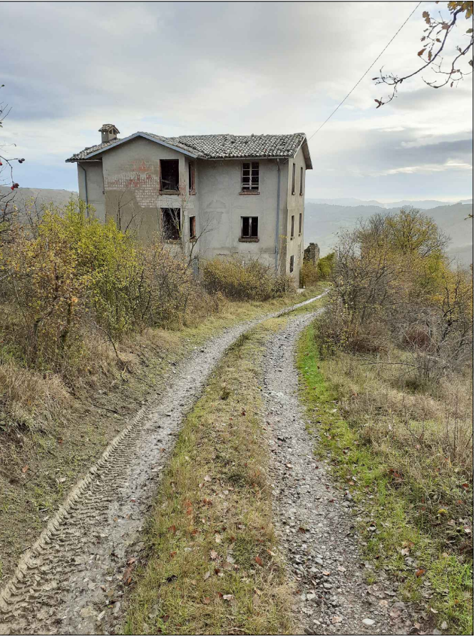
3. VIALETTO DI ACCESSO